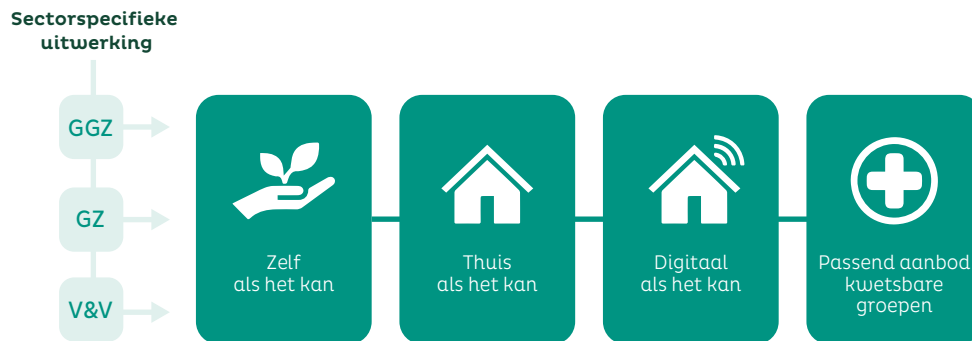
Figuur 2: Beweging naar een toekomstbestendige Wlz

Per sector worden in de sectorspecifieke paragraaf bovenstaande 4 bewegingen nader toegelicht.